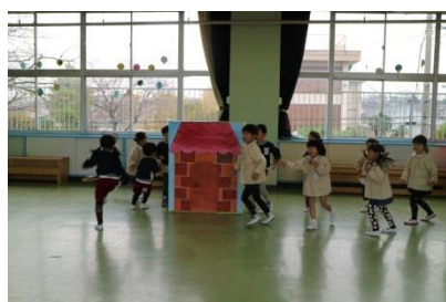
<さんびきのこぶた>